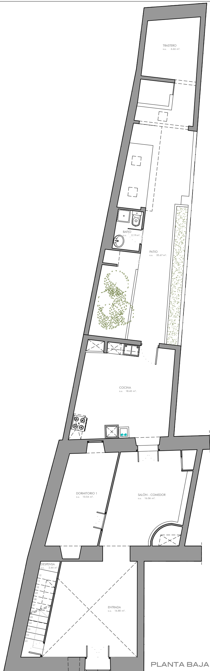
PLANTA BAJA E 1:100