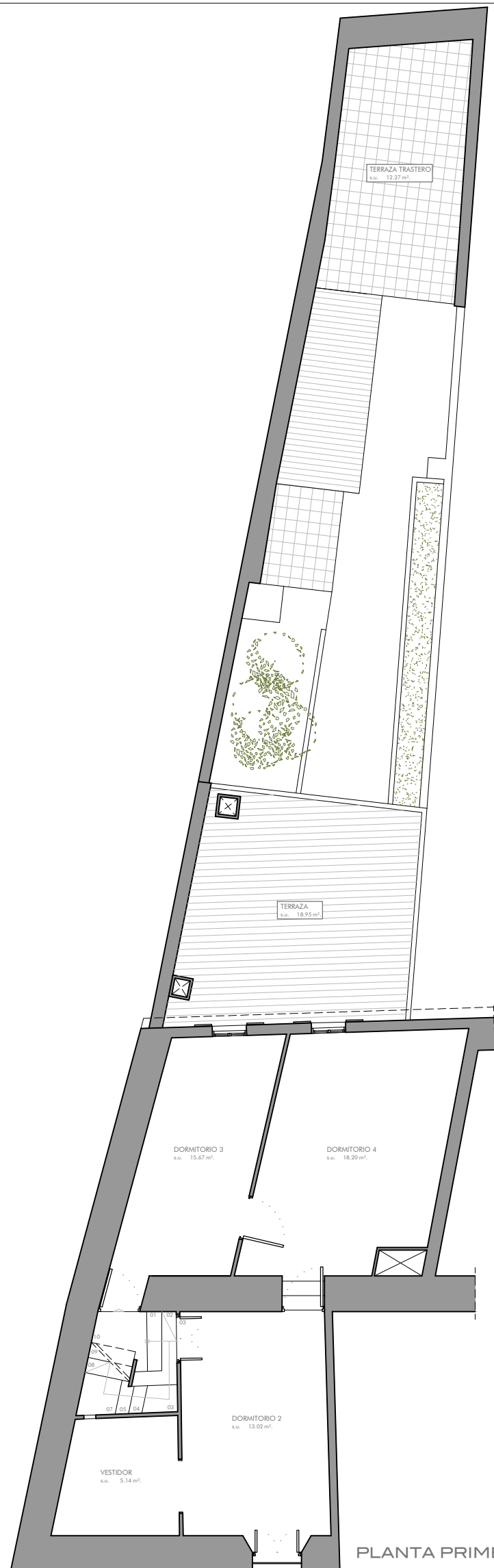
PLANTA PRIMERA E 1:100